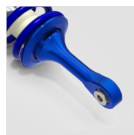
Réglage de détente

Le VENIUM est également disponible pour d'autres applications que les SSV ou le Rallye-raid.