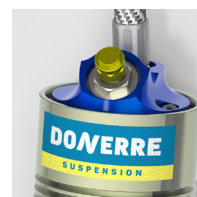
Réglages de compression (Haute et Basse vitesse)